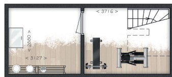
Kelder verdieping (optioneel)